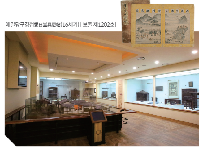
에일당구경첩愛日堂具慶帖(16세기) [보물 제1202호]

유교적 공동체의 실질적인 토대가 되는 가족문화의 이모저모를 소개하는 공간 가족의 형성과 유지 및 분화와 관련된 유물과 유교의 대표적 의례인 관·혼·상·제, 안방·사랑방 문화를 소개하는 코너 등으로 구성되어 있다.