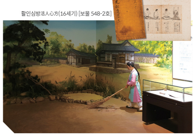
활인심방活人心方(16세기) [보물 548-2호]

유교적 실천론의 출발점인 공부론工夫論을 소개하는 공간 맹자의 사단설四端說을 통해 우리의 본성을 들여다보고, 유교적 실천론의 중심인 오륜의 내용을 가상마을 모형에 재미있게 소개해주는 '오륜마을'과 「활인심방」을 통해 유교의 몸공부에 대해 함께 생각해보는 코너 등으로 구성되어 있다.