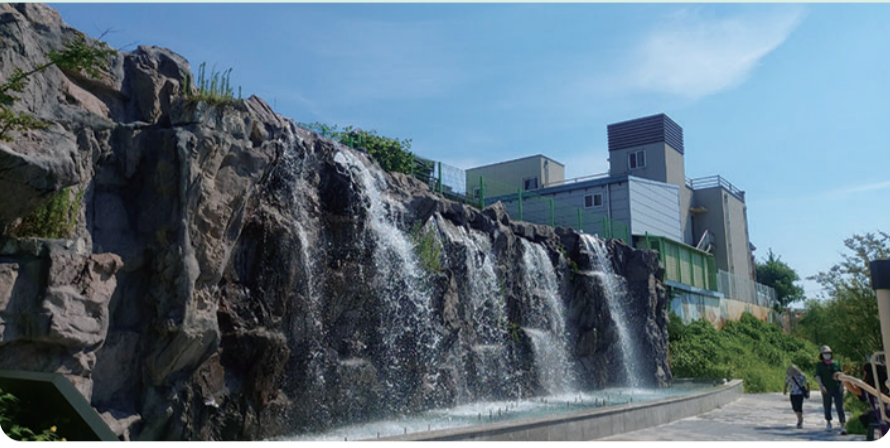
소룡동 선형공원 벽천분수 · 폭포 2시간 간격 가동

소룡동 선형공원이 낮에는 더위를 식히려는 시민들에게 시원한 물줄기를 내뿜고 밤에는 형형색색의 조명과 음악분수로 눈과 귀를 즐겁게 해주며 시민들의 휴식처로 자리잡았다. 오는 10월 9일까지 가동할 계획이며 폭포는 12시부터 18시까지 분수는 13시부터 20시까지 각 2시간 간격으로 약 10~15분간 운영된다. 특히 야간(19시, 20시)에 방문한다면 조명과 음악분수가 어우러지는 특별한 광경을 볼 수 있다.