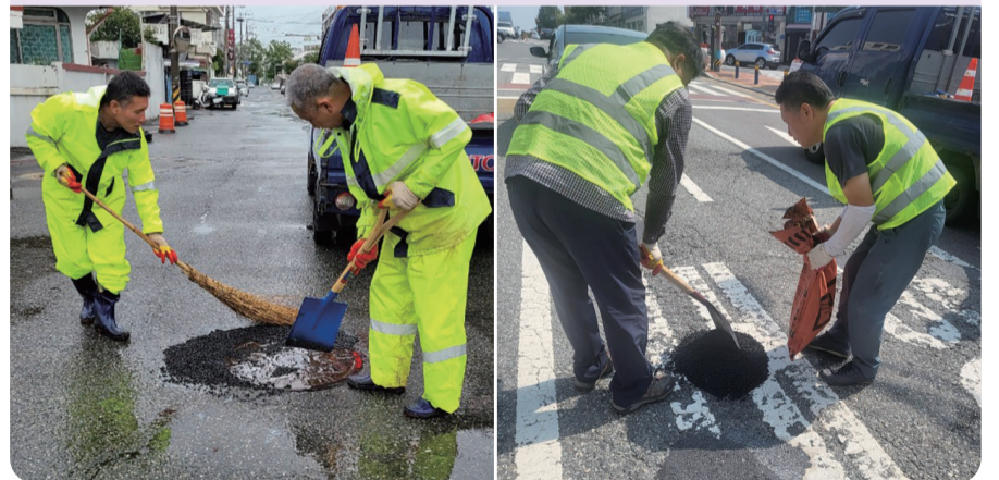
장마로 인한 파손도로 등

호우로 인해 파손된 도로를 일제 정비한다. 최근 관내 주요도로 99km 외에도 주요 간선도로와 보조간선도로에 대해서도 전수 조사를 실시해 정비구간을 선정했다. 정비구간은 △군산대 정문 교차로 △월명로 일대 △미성로 등으로 향후 약 80억원의 예산을 투입, 순차적으로 정비해 시민 불편을 최소화한다. 특히 노면요철, 포트홀, 거북등균열 등 정비가 시급한 구간에 대해서는 하반기 추경예산 26억을 확보해 즉시 추진할 방침이다. 도로 정비를 통해 안전사고 예방 및 도로환경이 개선될 것으로 기대된다.