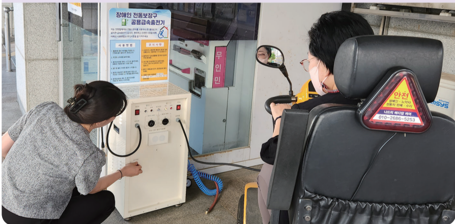
전동보장구 무료 급속충전기 설치지역 20개소로 늘어

장애인 및 거동불편 어르신들의 이동 편의를 제공하기 위해 장애인 전동보장구 급속충전기가 추가 설치됐다.