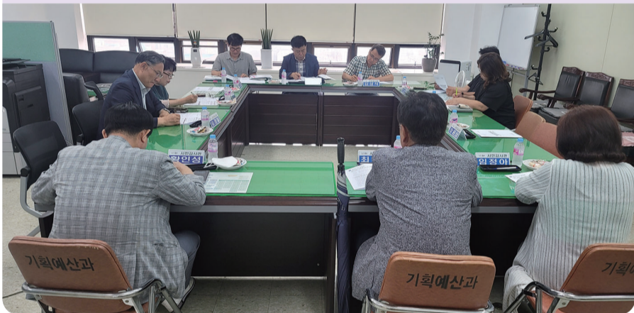
군산시민감사관 3기, 9월 4일까지 공개모집

시민들의 다양한 목소리를 반영하기 위해 '군산시민감사관' 3기를 모집한다. 모집인원은 기술사·회계사 등 전문분야 20명으로 행정관련 불편·불만 및 공무원 비위·위법 등 부당한 행정행위를 제보하고 시정발전을 위해 의견을 제시하는 역할을 한다. 보다 자세한 사항은 군산시 고시공고를 통해 확인할 수 있다.