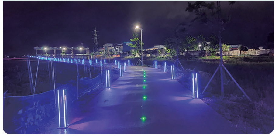
미장동 산책길 조명설치로 안전하게

미장동 산책길에 블라드형 및 바닥조명이 설치돼 늦은 저녁 산책하는 시민들의 발걸음이 이어지고 있다.