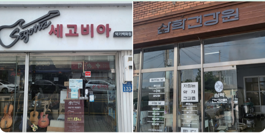
2023년 군산 전통명가 · 명예전통명가 선정

중양로1가에 위치한 대표 악기판매점 '세고비아'와 삼학동에서 건강즙을 생산하는 '삼학건강원'이 군산 전통명가와 명예 전통명가로 선정되는 영예를 안았다.