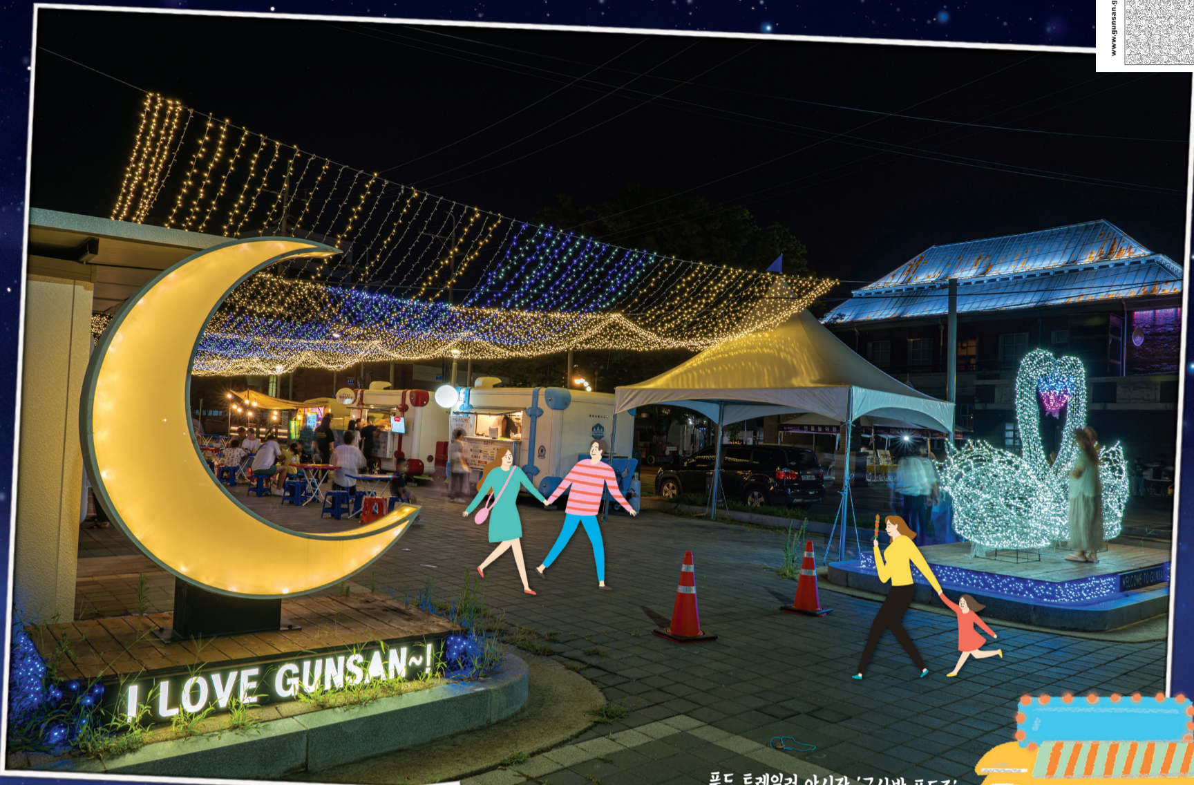
푸드 트레일러 야시장 '군산밤 푸드존'