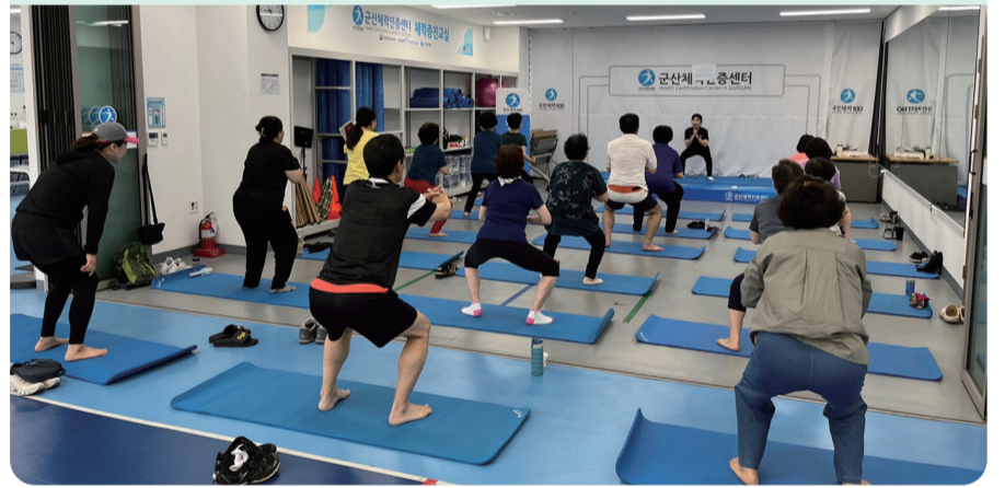
군산체력인증센터, 9월 1일까지 체력증진교실 4기 모집

군산체력인증센터가 시민 건강증진과 체력향상을 위해 4기 체력증진 교실(대면·비대면) 회원을 모집한다. 또한 평일 낮 시간 이용이 힘든 시민을 위해 야간프로그램(매주 화목 운영)도 추가로 운영할 예정이다.