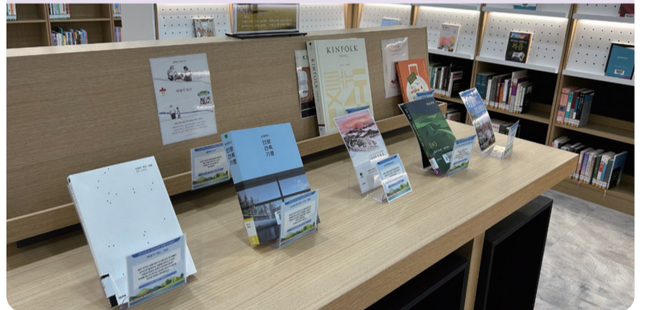
군산시립도서관 등 '우리동네 지역서점 북큐레이션' 운영

군산시립도서관 및 금강·늘푸른·산들도서관에서 지역서점의 개성있는 감성을 도서관 이용자들에게 소개하는 북큐레이션을 운영한다. 우리동네 지역서점 북큐레이션이란 주제를 정해 지역서점에서 선정한 책을 도서관 내 추천도서로 전시해 독자에게 소개하는 것을 말한다.