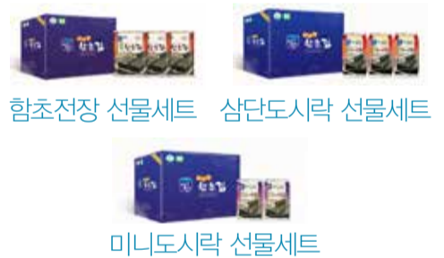
함초전장 선물세트 삼단도시락 선물세트