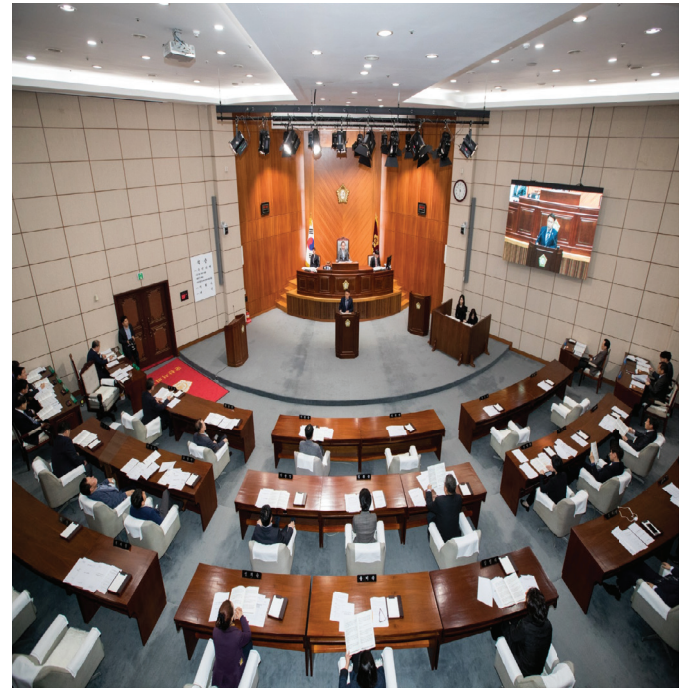
2019년도 군산시의회 운영계획(안)