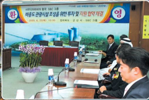
△ 군산시와 사우디 S&C사 협약식