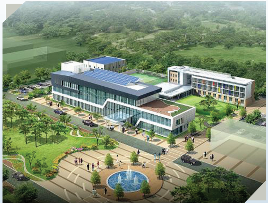
▲ 융복합 플라즈마 연구센터 조감도