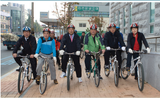
행정복지위원회_자전거도로 현장 체험