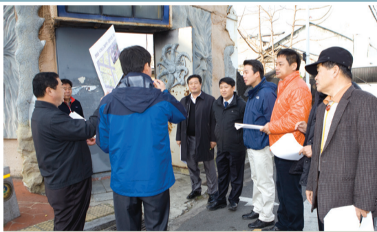
경제건설위원회_공영주차장 조성 예정지 현장 방문

군산시의회가 의원 본연의 임무인 회기중 의정활동 뿐만 아니라 비회기중에도 현장을 찾아다니며 민생을 챙기느라 분주한 일정을 소화해 내고 있다.