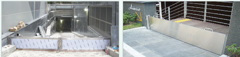
건축과 ☎ 450-4228