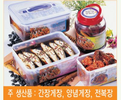
주 생산품 : 간장게장, 양념게장, 전복장