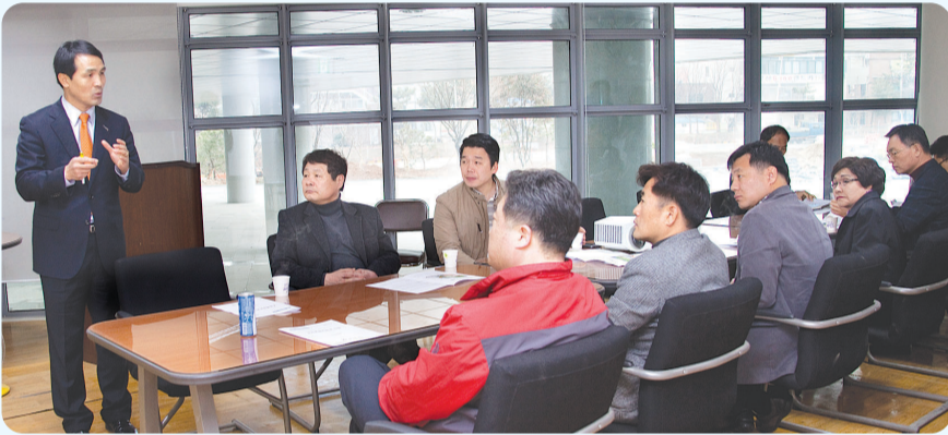
▲ 예술의전당 건립 현장 (행정복지위원회)