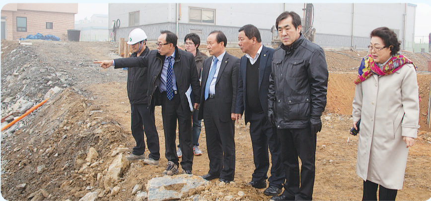
▲ 폭우로 인한 도로 유실 복구현장 (경제건설위원회)