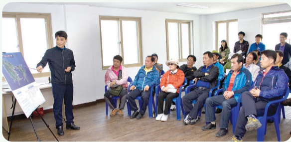
◀ 도서지역(어청도) 현장방문

시의회는 현안사업이 차질없이 진행되어 시민에게 불편이 없도록 최대한 노력을 기울일 것이며, 현장에 가면 답이 있다는 각오로 현장행정에 중점을 두고 의정 활동을 펼치겠다고 밝혔다.