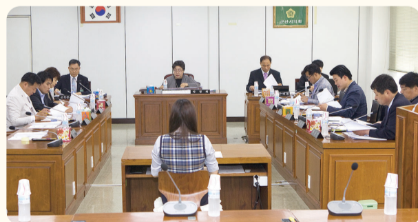
◀ 행정복지위원회 간담회

이번 간담회는 추진부서와 격의없는 대화를 통해 폭넓은 의견수렴과 다양한 정책대안을 마련하는 등 전반적인 검토가 이뤄졌다는 평이다.