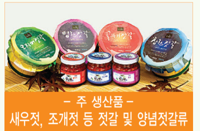
- 주 생산품 - 새우젓, 조개젓 등 젓갈 및 양념젓갈류