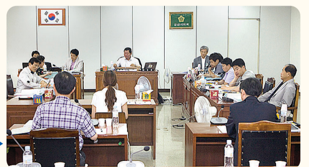
▶ 경제건설위원회 간담회