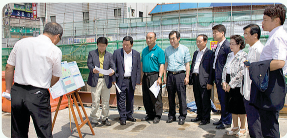
장마철 피해예방 현장방문