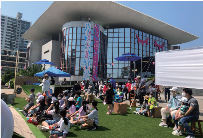
〈거인의 초대-주차공간 활용 사회실험〉

특히, 행안부 공모사업으로 선정된 지역거점별 소통협력공간 조성 사업과 연계하여 복합문화공간으로서의 역할 뿐만 아니라, 지역이 가지고 있는 다양한 현안 문제들을 시민들과 함께 고민하고 해결해 나가는 장소로서의 기능이 더해짐으로써 지역활력을 견인할 새로운 거점공간이 될 것으로 기대된다.