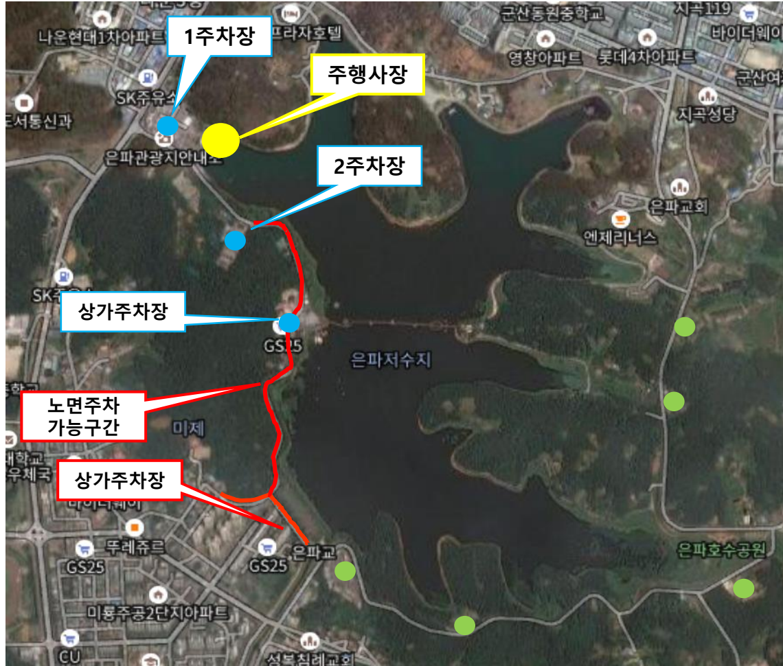
행사장 주변 주차현황