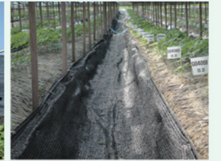
정비 잘된 고랑