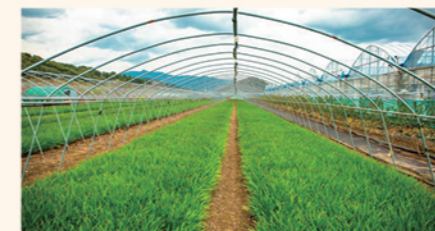
비닐 사전 제거 하우스