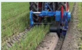
배수로 조성기 이용