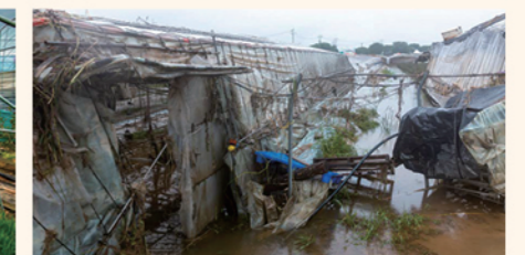
일반 피해 하우스