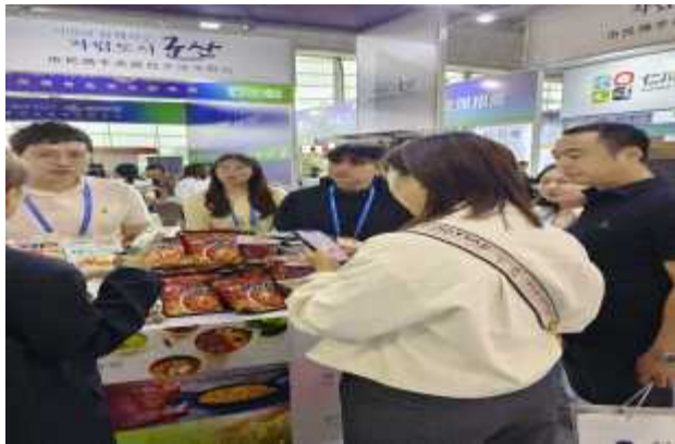
웨이하이 제5회 한국(산동)수입상품박람회 현장사진(군산관)