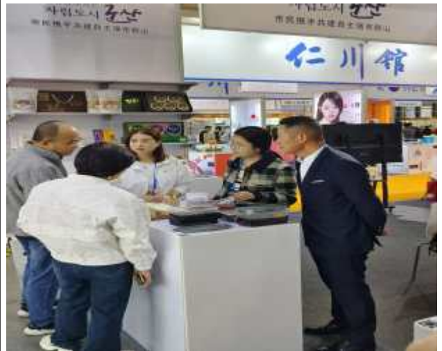
웨이하이 제5회 한국(산동)수입상품박람회 현장사진(군산관)