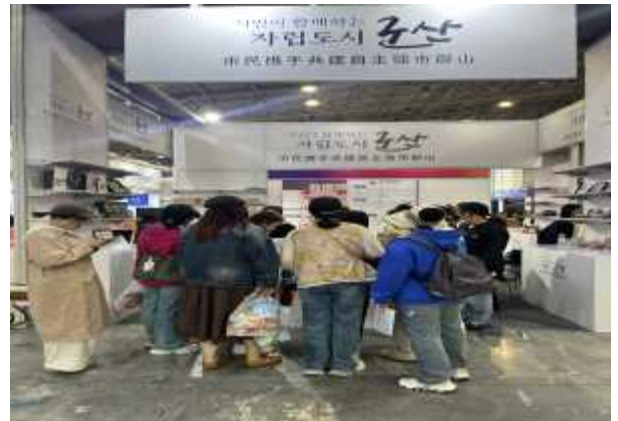
웨이하이 제5회 한국(산동)수입상품박람회 현장사진(군산관)