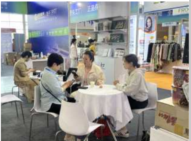
바이어 상담 현장사진(군산관)