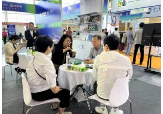
바이어 상담 현장사진(군산관)