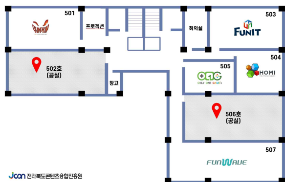
(재)전라북도콘텐츠융합진흥원 5층 배치도