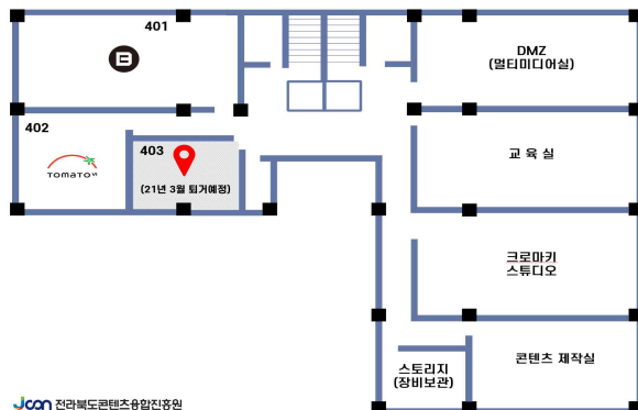
(재)전라북도콘텐츠융합진흥원 4층 배치도