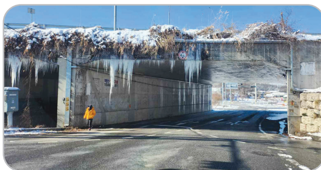
고드름 낙하 위험