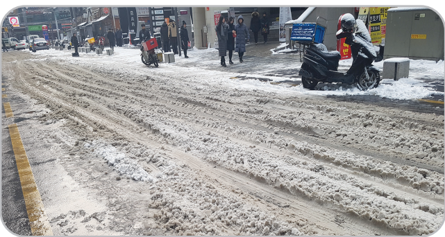
도로 제설 미흡