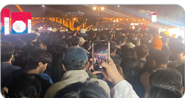
인파 밀집 우려