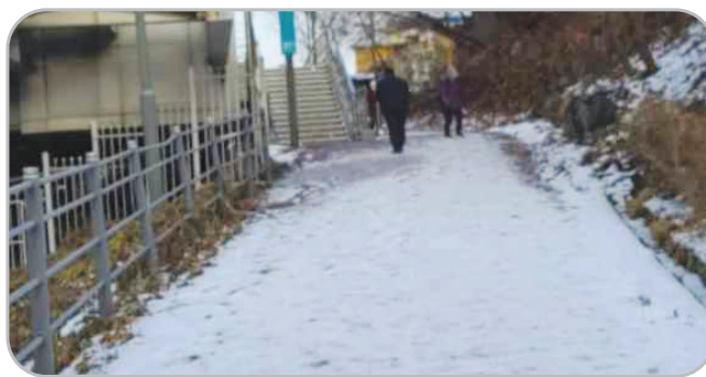
인도 제설 미흡