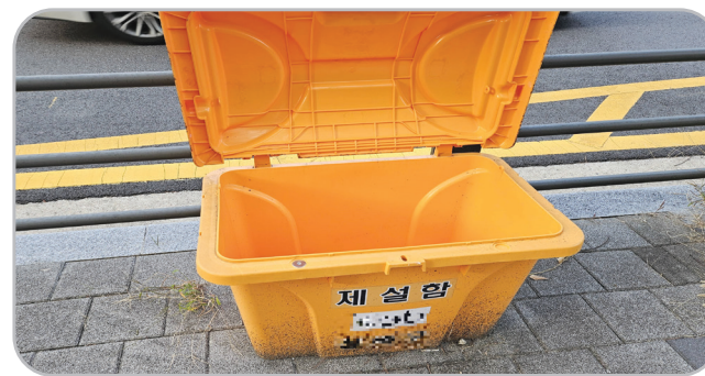
제설 물품 부족