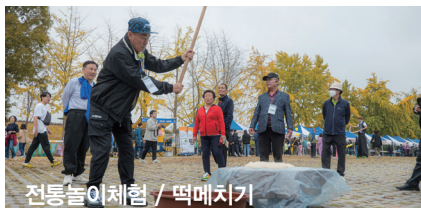
전통놀이체험 / 떡메치기