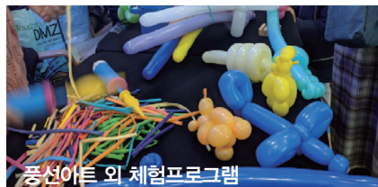
풍선아트 외 체험프로그램