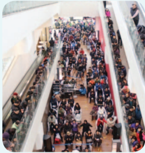
리포터 - 고택자 -

서울에 거주하는 이유로 명절을 맞아 오랜만에 전통시장을 방문한 친척들은 "시장이 마트보다 깨끗해 놀랐다"며 "가까운 곳에 이런 전통시장이 있는 군산이 부럽다"고 입을 모았습니다. 전통시장은 꼭 명절 때가 아니더라도 항상 다양함과 착한 가격으로 고객들을 기다리고 있습니다.