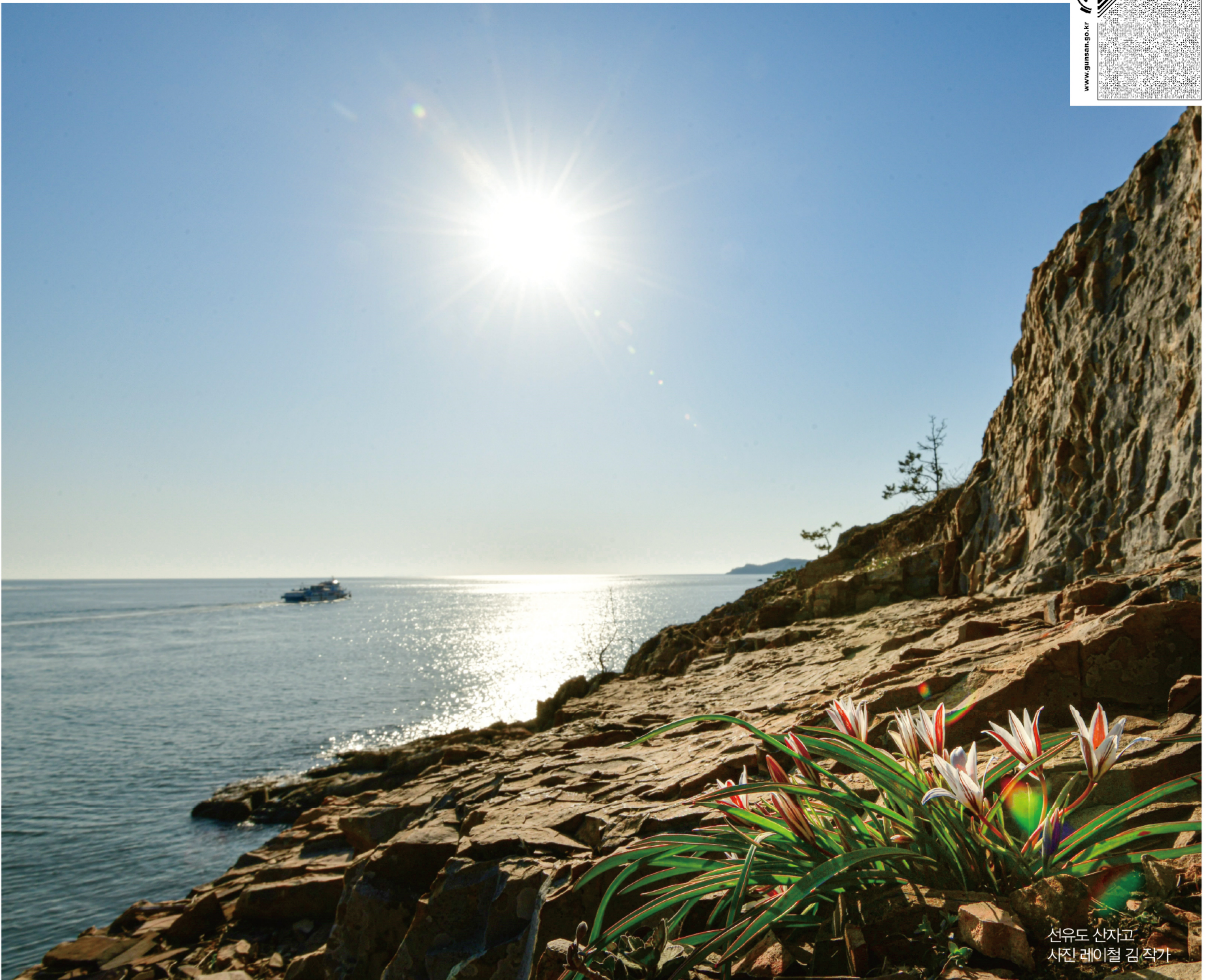
선유도 산자고