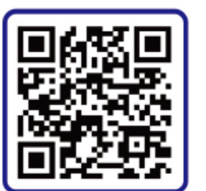
군산시 공식 SNS 링크 바로가기