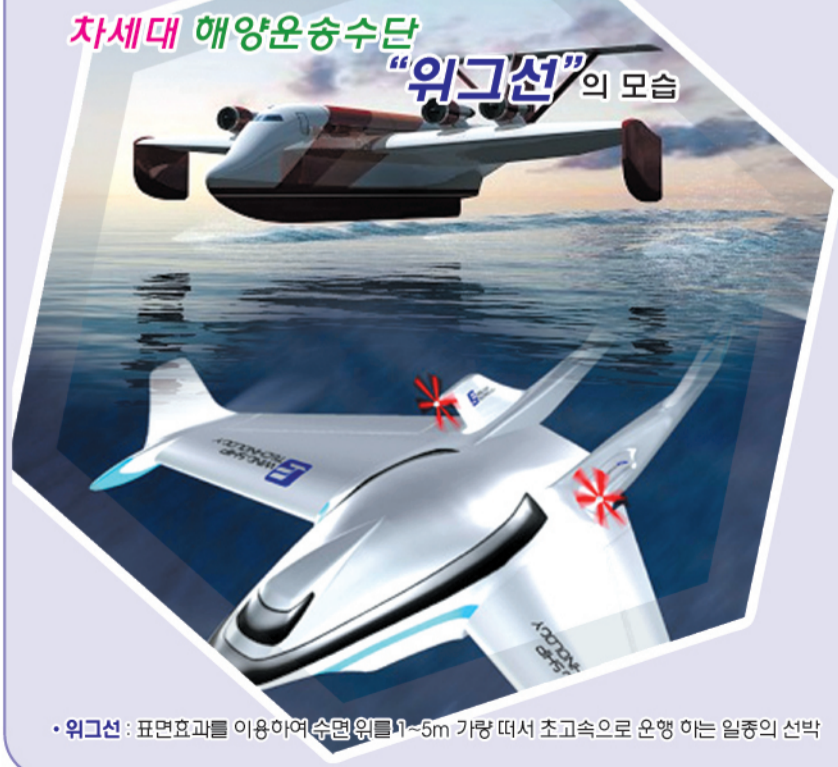
· 위그선 : 표면효과를 이용하여 수면위에서 5m 가량 떠서 초고속으로 운행 하는 일종의 선박