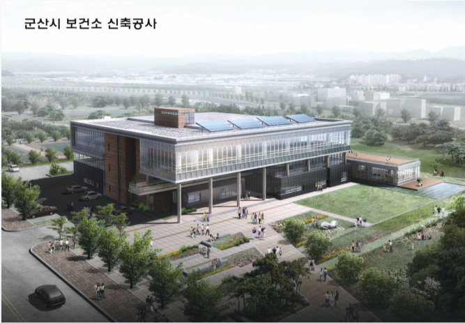
군산시 보건소 신축공사

군산시는 지난 17일 수송동 보건소 신축부지내에 군산시 보건소 이전 건립 기공식을 가졌다. 신축 보건소는 7,562.2㎡의 부지에 연면적 6,168.82㎡ (지상3층/지하1층)의 규모로 2월에 착공하여 2011년 12월에 준공될 예정이다.