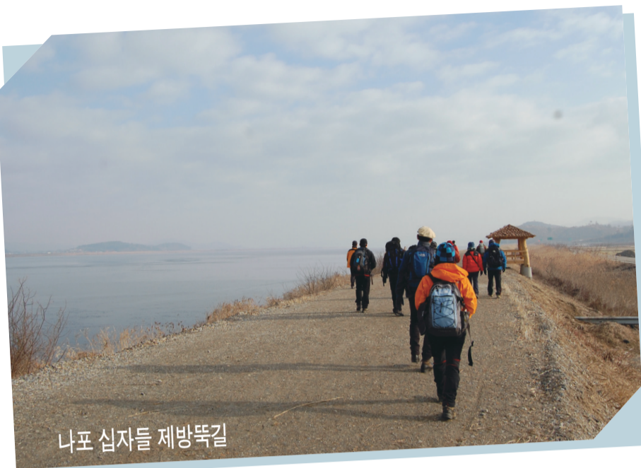
나포 십자들 제방뚝길